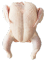
POLLO DE 9