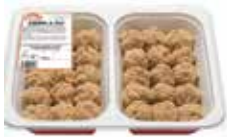
ALBÓNDIGAS DE POLLO