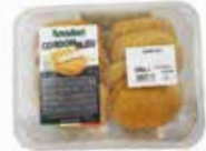
CORDON BLEU PREFRITO