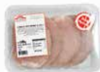
PECHUGAS DE PAVO AL AJILLO

069 Bandeja: +/- 500 g. 059 Bandeja: +/- 2 kg.