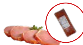
LOMO ADOBADO EXTRA