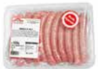
LONGANIZA BLANCA DE POLLO

069 Bandeja: +/- 500 g. 059 Bandeja: +/- 2 kg.