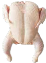
POLLO DE 6