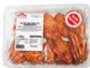
ALITAS DE POLLO ADOBADAS