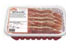
CHULETA DE PAVO CON AJO Y PEREJIL

379 Bandeja: +/- 500 g. 279 Bandeja: +/- 2 kg.