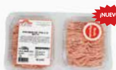
PICADA DE POLLO (BURGER MEAT) Por encargo