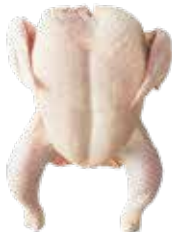
POLLO DE 8