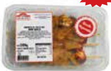
BROCHETA CON ADOBO ANDALUZ