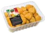
NUGGETS DE POLLO PREFRITOS

321 York y queso 319 Morcilla con manzana