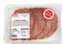
PECHUGAS DE PAVO ADOBADAS