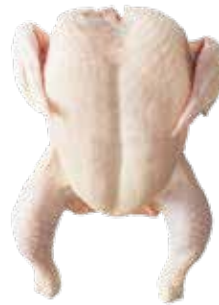
POLLO DE 5