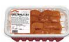
PINCHOS MORUNOS DE POLLO